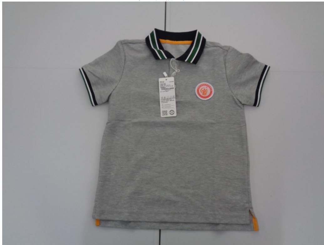
灰色短袖 T 恤