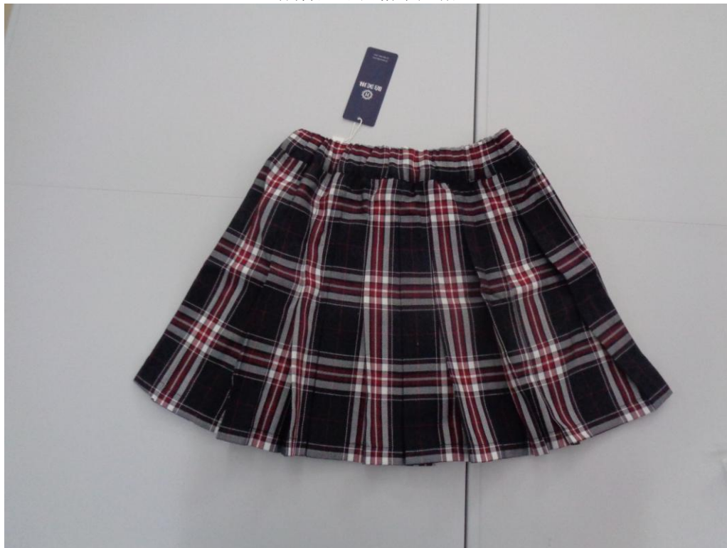
藏青/红/白格子短裙